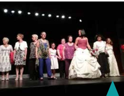
Défilé de l'atelier de couture

Succès garanti pour les galas de fin d'année du CALM