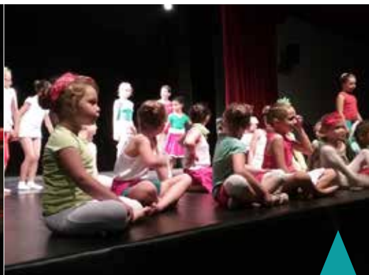
Final du gala de danse