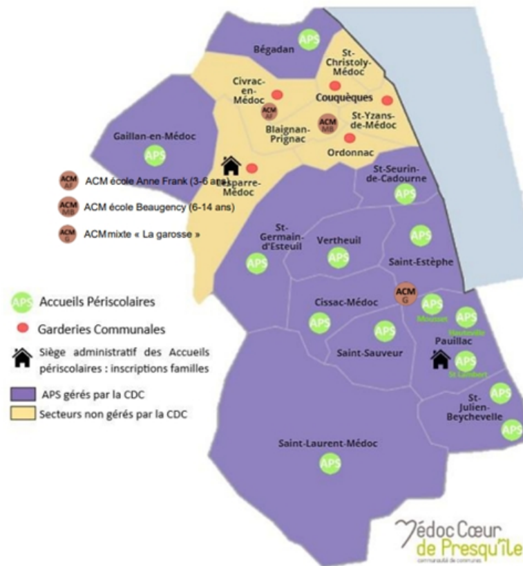
Carte n° 1 : carte de l'accueil périscolaire par entité compétente (communes, communauté de communes de Médoc-Cœur-de-Presqu'île)

Nota bene : CDC : communauté de communes ; APS : activités périscolaires ; ACM : accueils collectifs de mineurs